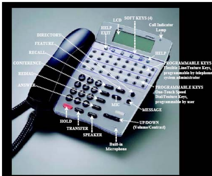
Gambar 8.4. Dterm Attendant Console

Attendant Console (Dterm – merk dagang untuk console PABX NEC) adalah perangkat berbentuk pesawat telepon. Perangkat ini digunakan untuk memprogram dan jika tidak digunakan untuk memprogram dapat digunakan sebagai pesawat telepon biasa berbasis jalur digital. Bentuk Attendant Console ditunjukkan pada gambar 8.4.